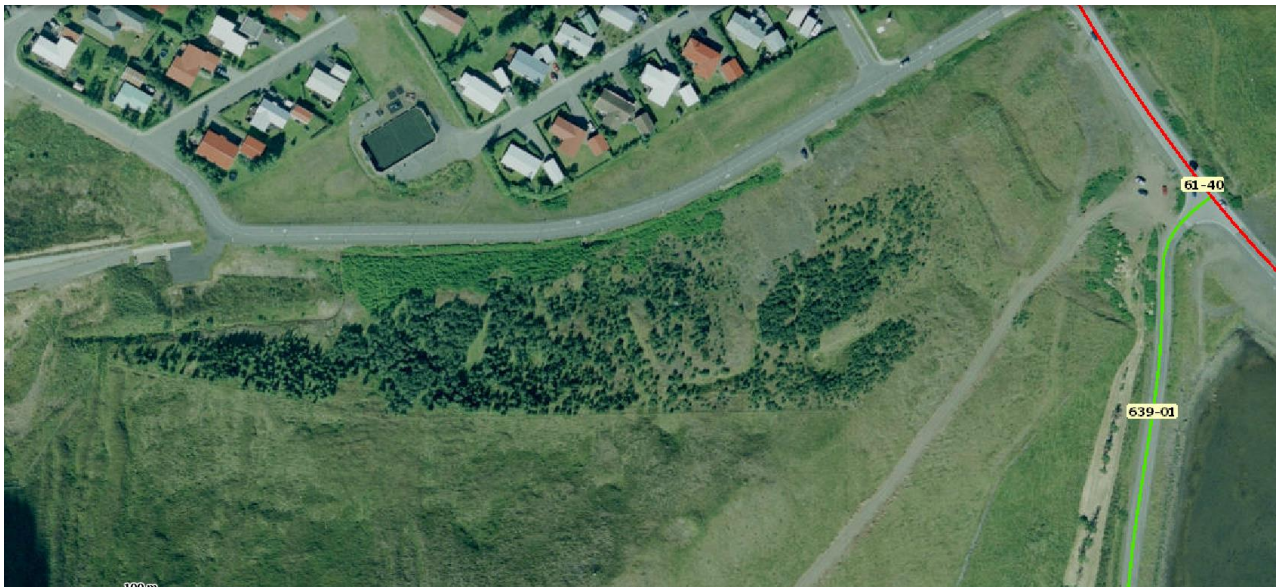
Mynd 1. Plöntunarsvæði frá um 1990 sem er rúmir 2 ha.

Félagið plantaði í Hafrafellsháls Holtahverfismegin frá 1990 í ca 3 ár. Árangunn sést vel nú og er glæsilegur. Sjá mynd 1.