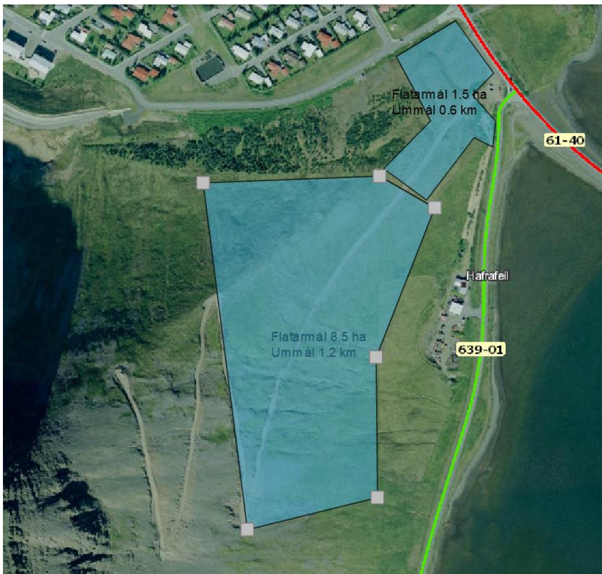
Mynd 3. Gróf hugmynd að nokkuð stóru, eða 8,5 ha skógræktarsvæði á Hafrafellshálsi og ofan Hafrafells.